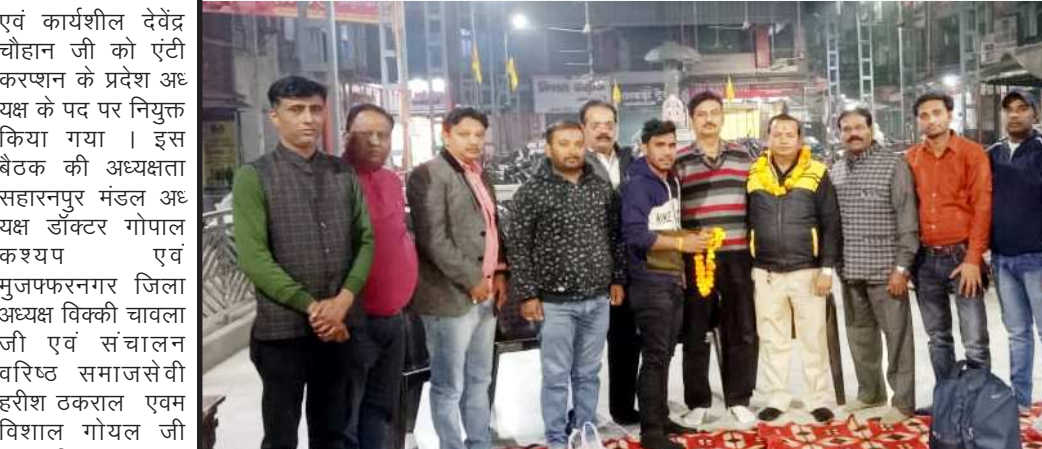
समय से समाज में होने वाले अपराधों और भ्रष्टाचार का विरोध करते आए हैं ठीक उसी प्रकार भविष्य में भी विरोध करते रहेंगे। प्रदेश अध्यक्ष के साथ