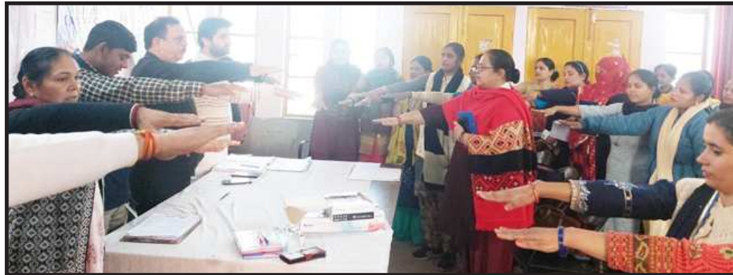
थानामवन। विश्व एड्स दिवस पर सामुदायिक स्वास्थ्य केंद्र के चिकित्सा

वह भी सामान्य लोगों की तरह ही अपना जीवन बिता सकते हैं, साथ घूमने-फिरने या साथ खाना खाने जैसे व्यवहार से एड्स एक दूसरे में नहीं फैलता। उन्होंने लोगों को जागरूक करते हुए कहा कि एक दूसरे के साथ असुरक्षित यौन संबंध बनाने, संक्रमित व्यक्ति का रक्त दूसरे व्यक्ति में चढ़ाने से ही यह बीमारी एक दूसरे में फैलती है इसलिए एड्स जैसी बीमारी से पीड़ित लोगों के साथ भी अन्य दूसरे व्यक्तियों की तरह ही समान व्यवहार करें। उन्होंने लोगों को एड्स की बीमारी के बारे में जागरूक किया। उन्होंने कहा कि एड्स जैसी बीमारी से बचने के लिए हम अगर एहतियात बरतेंगे तो निश्चित रूप से लोग इस बीमारी से ग्रस्त नहीं होंगे। इस मौके पर सामुदायिक स्वास्थ्य केंद्र में तैनात सभी स्वास्थ्य कर्मियों ने विश्व एड्स दिवस पर संकल्प लिया कि हम जीवन पर्यंत लोगों को इस गंभीर बीमारी के बारे में जागरूक कर रहे रहेंगे।