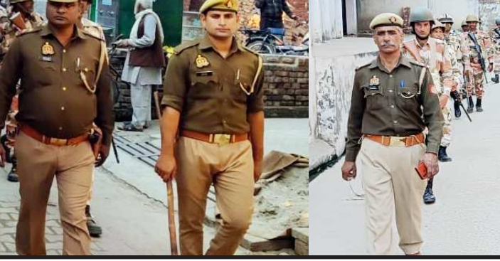
के विरुद्ध सख्त कार्यवाही की चेतावनी भी दी गयी। सिखेडा पुलिस द्वारा